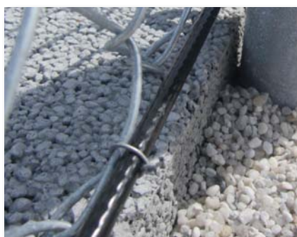
Câble acier gainé 6mm partie basse