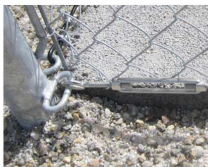
Tendeur à lanterne en inox