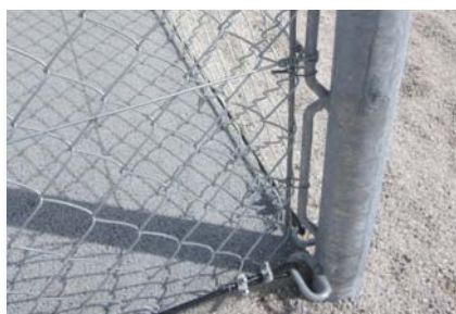
Poteau d'angle avec barre de maintien soudée.