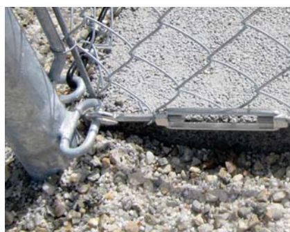
Tendeur à lanterne en inox