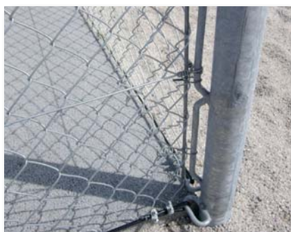
Poteau d'angle avec barre de maintien soudée.