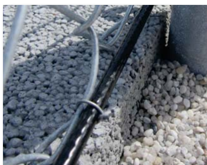
Câble acier gainé 6mm partie basse