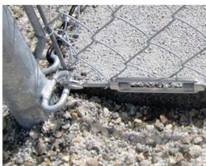
Tendeur à lanterne en inox